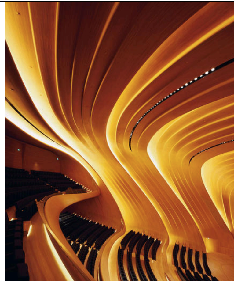
Haydar Aliyev Center, Baku.

Ora i grandissimi, e Hadid è tra questi, conformano il mondo con la loro storia e con il loro imprinting e lo