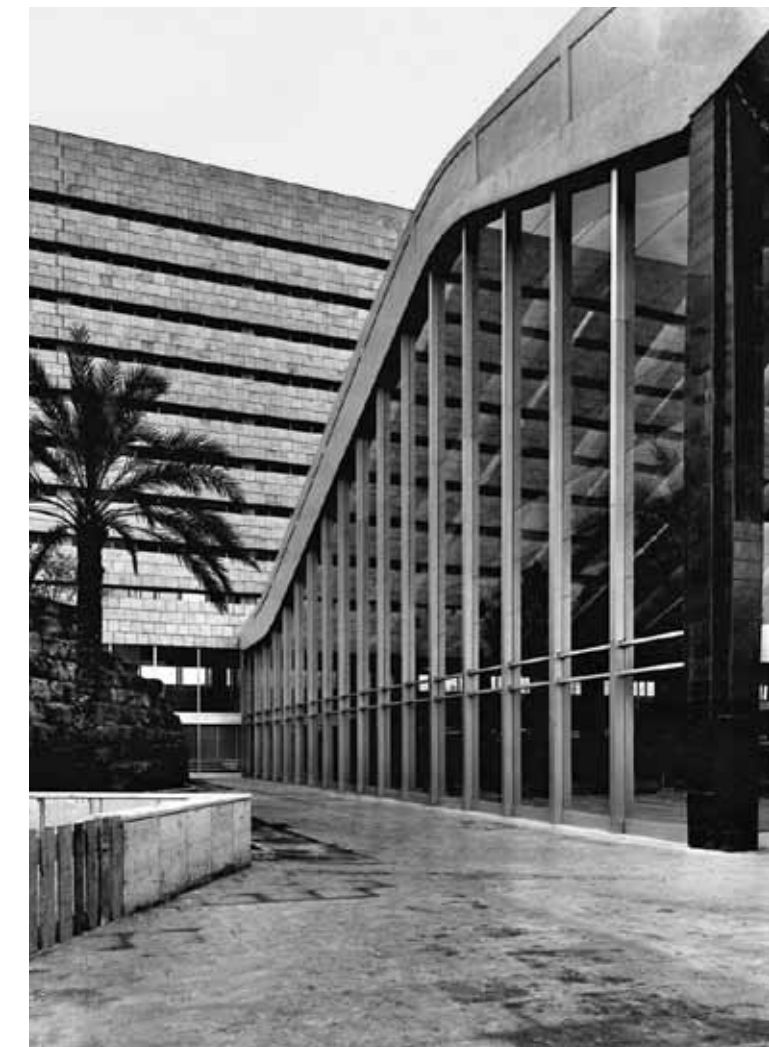
Stazione Termini, Roma, 1949, Montuori-Vitelozzi-Calini-Castellazzi-Fadigati-Pintonello