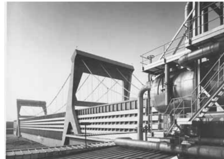
Cartiera Burgo, Mantova, 1961-64, Pier Luigi Nervi

THE ABILITY TO BE “ANTI”, TO CONSTANTLY CALL FOR DISSONANCE, IS ONE OF THE DRIVING FORCES BEHIND ZEVI'S THINKING