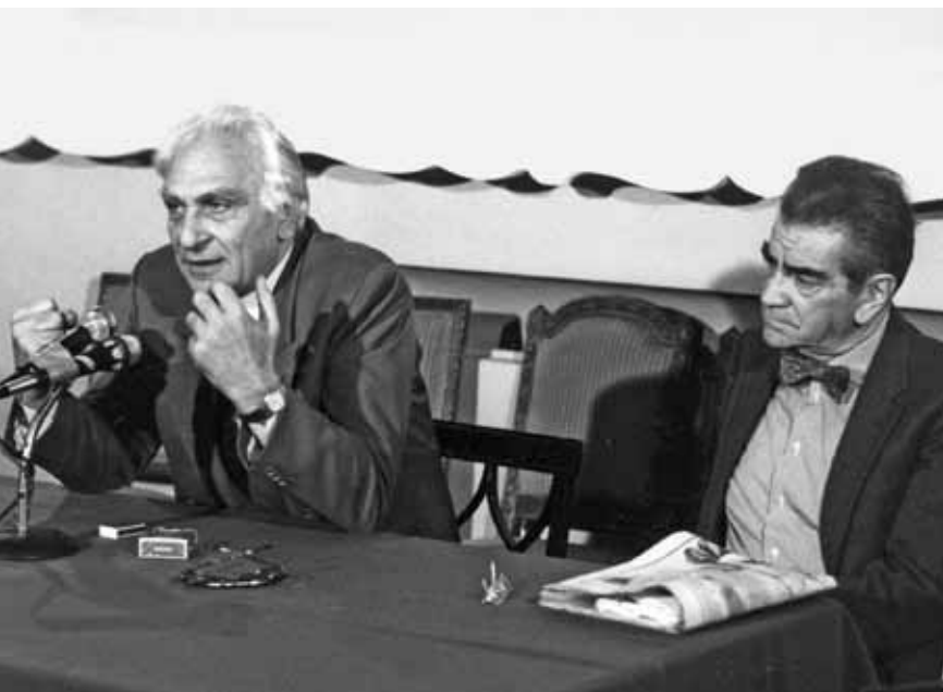
■ Sopra, Bruno Zevi con il politico radicale Marco Pannella. Sotto, una foto della mostra che il Maxxi di Roma dedica a Zevi, in corso fino al 16 settembre.